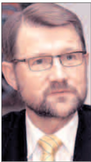
Videnskabsminister Helge Sander værdsætter automatisering